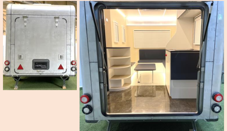
有効開口寸法は幅1207mm×高さ1385mm。床面の高さが地上から480mmとなっていて、荷物の積み降ろしや人の乗り降りも楽々です。