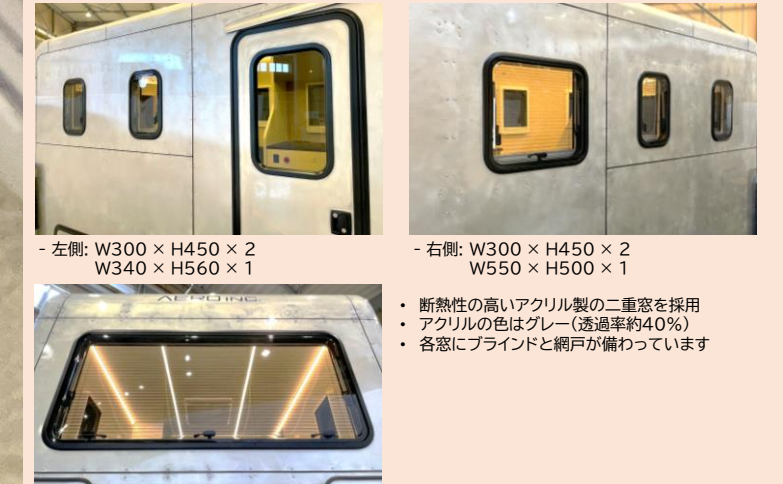
- 左側: W300 × H450 × 2 W340 × H560 × 1