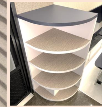
出入口の脇には靴などを置く3段の棚を備えています。