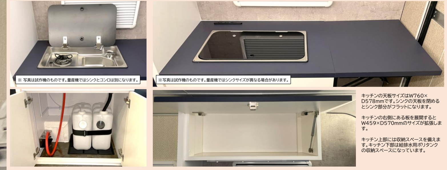
※写真は試作機のもので、量産機ではシンクとコンロは別になります。