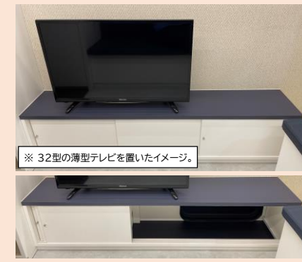
※32型の薄型テレビを置いたイメージ。